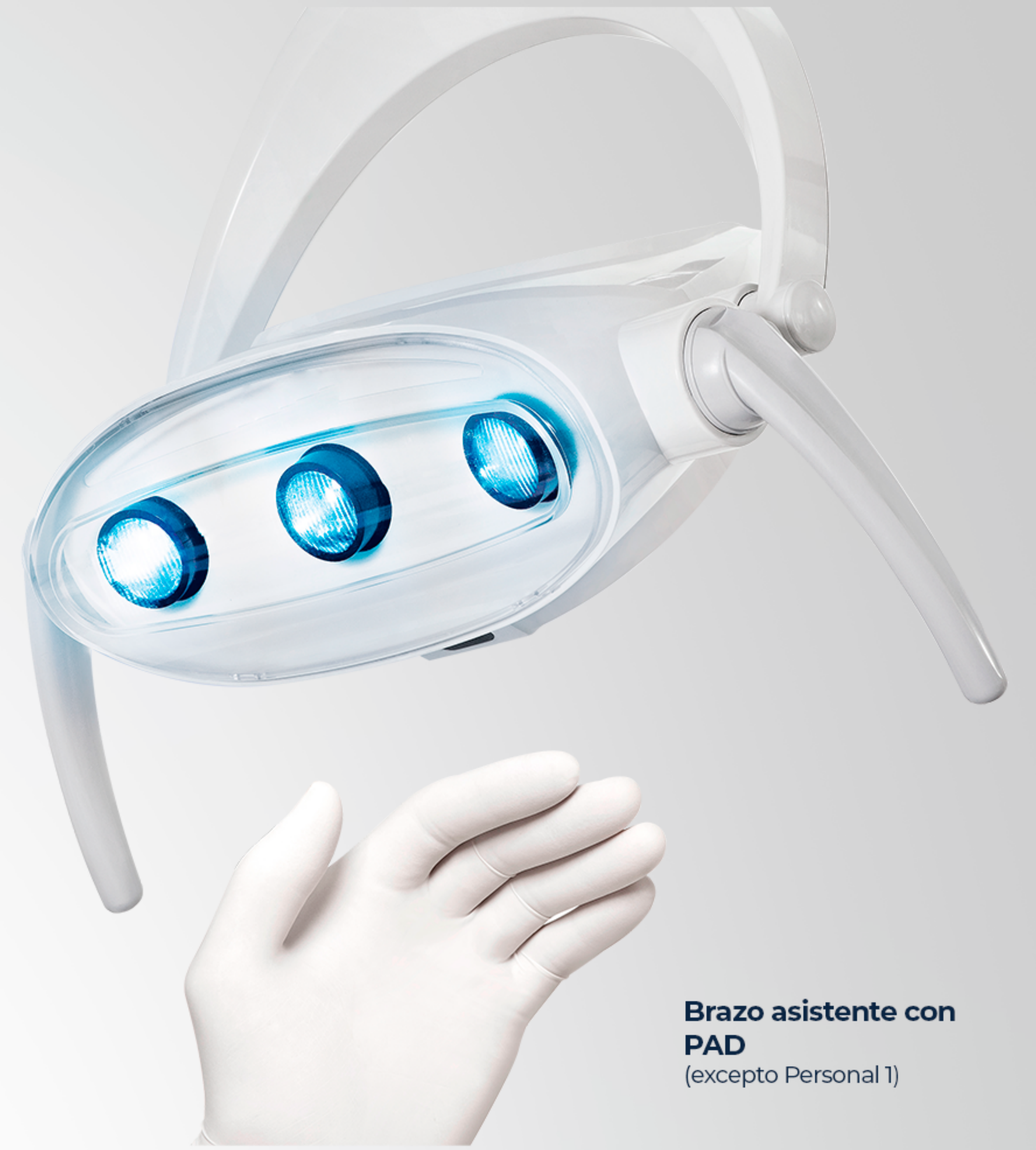
Brazo asistente con PAD (excepto Personal 1)