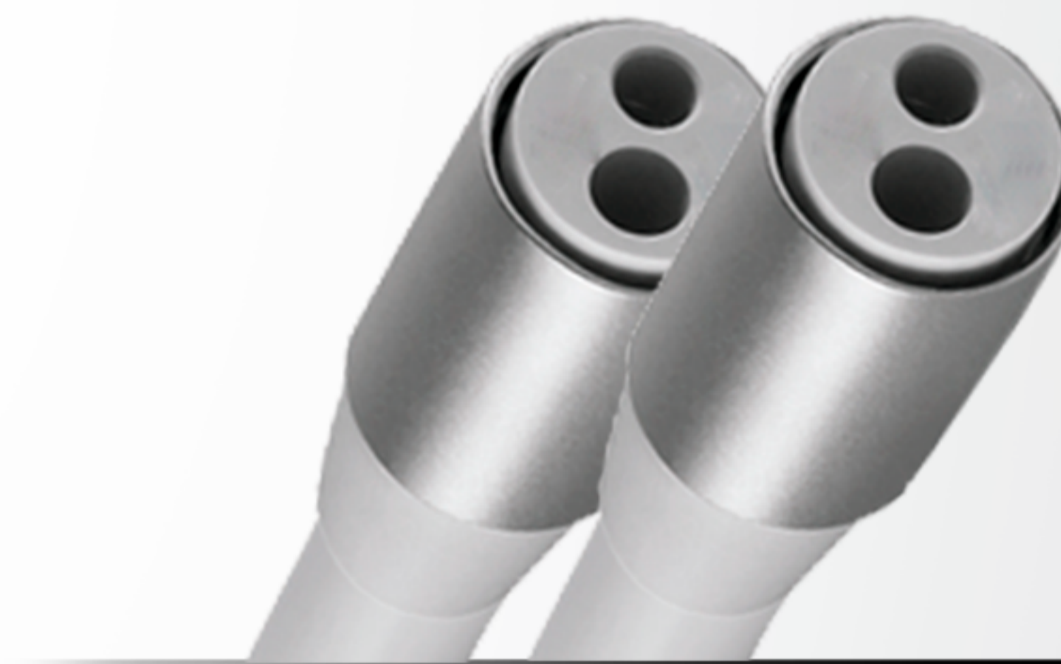
Unidad de Agua con sensor de proximidad